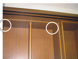
A4W固定Boxのボルト穴です。(左右に1箇所ずつ、計2箇所)