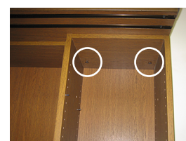
A3固定Boxのボルト穴です。(左右に1箇所ずつ、計2箇所)